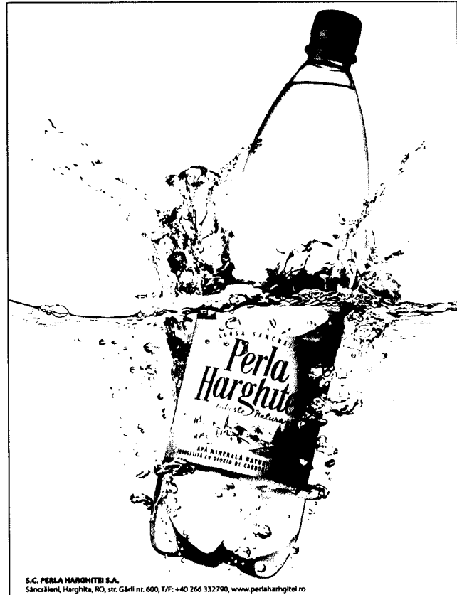
S.C. PERLA HARGHITA S.A. Sâncrăreni, Harghita, NO, str. Gării nr. 600, T/F: +40 266 332790, www.perlaharghita.ro

Informațiile privind potențialul impact asupra mediului al planului propus pot fi consultate la sediul APM Harghita din Miercurea Ciuc, str. Márton Áron, nr. 43. Observațiile publicului se primesc în scris, cu datele de identificare ale reclamantului, zilnic, între orele 08:00-16:30, la sediul APM Harghita, până la data de 13.04.2019.