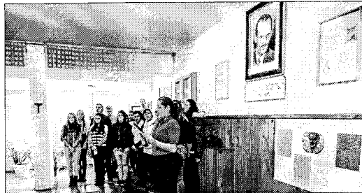
Diákok köszöntötték a vendégeket. Rendhagyó megemlékezés