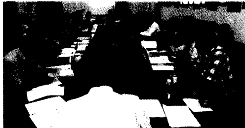
Az első tanácsülés. Kezdet

Egy tanácsosi frakció létrejött: is bejelentették az ülést, amelyet a